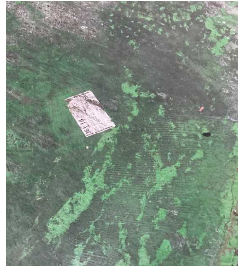
商品ラベルが貼りついた床